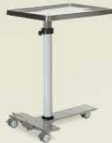
Mayo Masa [MMH 2175]