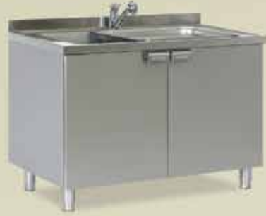
Endoskop Yıkama Eyesi [MYT 1049]