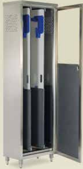
Endoskop Dolabı [MED 7502]