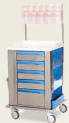
Anestezi Arabası [MCCA 6450]